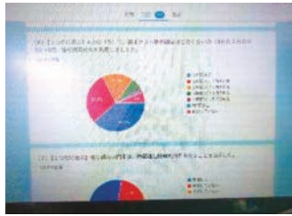
▶ アンケートの集計

全校生徒を対象に情報通信機器の使用状況についてのアンケートを実施しました。紙のアンケートとは違い回収の手間が省けますし、集計やグラフ作成まで自動で行ってくれます。数学では、自分の考えをまとめたり説明したりするのに使用しています。相似の単元では実際に木と人が並んだ写真を撮り、比を用いて木の高さを求めました。