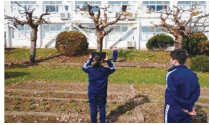
▼ 比を用いて木の高さを求める

また、個人的な見解にはなりますが1人1台のタブレット活用の利点を活かし、欠席時にオンラインにて授業を受けることや、有事・災害の際は家庭にしながら学校からの情報配信及び共有体制を整えていくことが課題と考えられます。